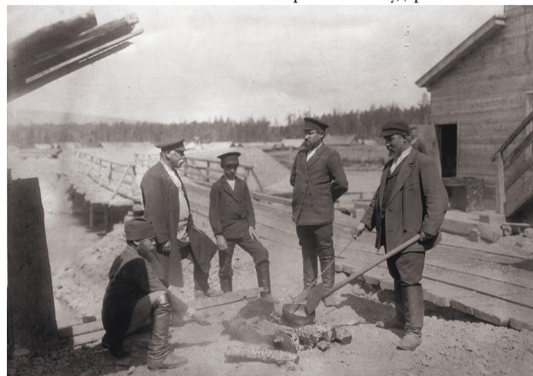
Обжиг руты в ковше после промывки золота. Урал. Начало XX вв.

цын в 1817 году горные чиновники Адольф Агте и Николай Мундт открыли россыпи золотоносного песка на реке Мельковке в городе Екатеринбурге. Они планировали открыть частный прииск, но казна быстро перекупила участок, и в том же году на Мельковке, в начале