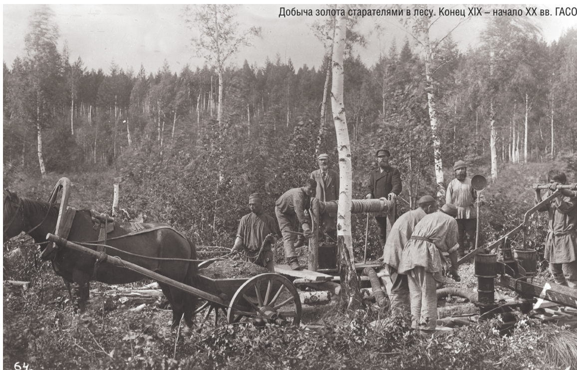
Добыча золота старателями в лесу. Конец XIX – начало XX вв.

До 1814 года в России добывали только рудное золото. Это был тяжелый и дорогостоящий труд: руду добывали в подземных шахтах, в темной штольне по колено в воде, затем вручную выносили