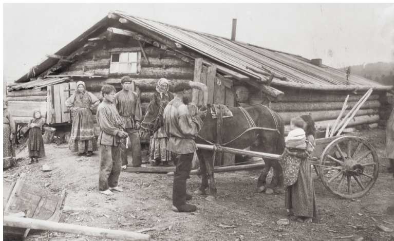
Сборы старателей по золоту на прииск. Урал. Начало XX вв.