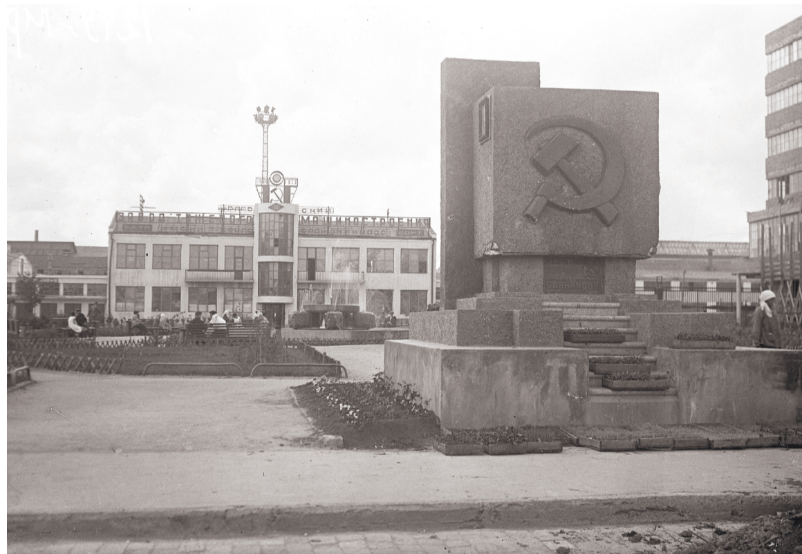
Памятник начальнику Уралмашстроя А.П. Банникову на площади Первой Пятилетки на Уралмаше. 1934 г. ГАСО

ленную зону с жилым массивом. Через мавзолей производилась постоянная сакрализация труда: он закреплял представление о заводе как о месте подвига, формировал образ Уралмаша как особого социального организма, где пространство было организовано по законам идеологической выразительности.