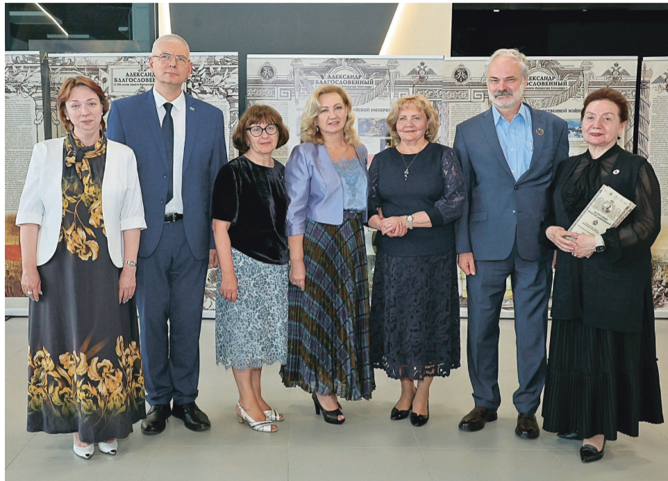
На открытии выставки «Александр Благословенный»