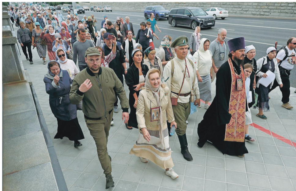
Крестный ход от Храма-на-Крови до монастыря на Ганиной Яме

Доклады, представленные на конференции, освещали деятельность представителей Императорского Дома Романовых, их ратные подвиги, государственную и благотворительную деятельность. Государственным архивом Свердловской области был подготовлен доклад, повествующий о визите Александра I на Урал в 1824 году. В основу доклада легла находящаяся в архиве на хранении рукопись, принадлежащая перу неизвестного автора первой половины XIX века, которая так и называется «О пребывании государя императора Александра I на Екатеринбургских заводах 1824 года». Император провел на Урале три дня. Осмотрел Монетный двор, гранитную фабрику,