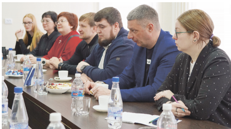
Ямальская делегация, посетившая подшефный район, на встрече с коллегами. г. Волноваха. 2025 г.