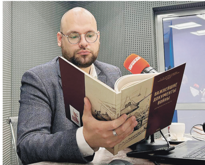
Роман Дорохин, Заместитель Министра культуры Свердловской области, ведущий программы «Культурные люди»

он получил название Центр документации общественных организаций. Во второй книге мы постарались на примере партийных документов, в основном решений Свердловского обкома партии, показать роль Свердловской области как тылового региона во время Великой Отечественной войны. Все мы прекрасно знаем о предприятиях, учреждениях, гражданских лицах, которые были эвакуированы на Урал; о большом количестве эвакуационных госпиталей, размещенных в городах Свердловской области, и эти аспекты участия Свердловской области в Великой Отечественной войне подтверждены необходимыми документами данной книги. Кроме того, книга снабжена QR-кодами, перейдя по которым можно увидеть более подробную информацию о том или ином документе. Также в книге имеются архивные фотоматериалы, относящиеся к годам Великой Отечественной войны 1941–1945 гг.