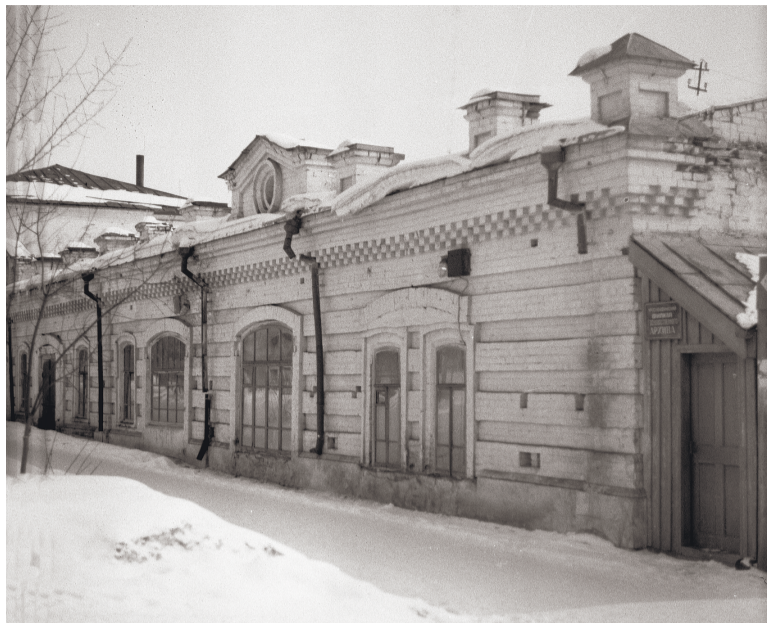
Общий вид здания филиала ГАСО в городе Красноуфимске (ул.Светская, 7). ГАСО

Нелегко было настроить работу филиала архива: помещение на первом этаже райисполкома было маленьким, непригодным для хранения документов, не было ни шкафов, ни полок. Документы поступали в неупорядоченном состоянии, совершенно отсутствовал учет. За период с 1945 по 1949 год архив переезжал 7 раз, но должных условий так и не было создано.