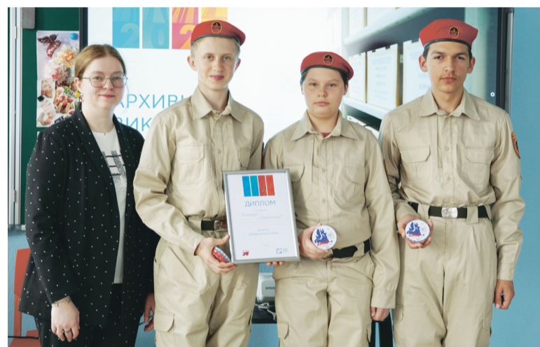
Проведение архивного урока и викторины в образовательных организациях г. Волновахи. 2025 г.

25 архивных стеллажей и 265 архивных коробов.